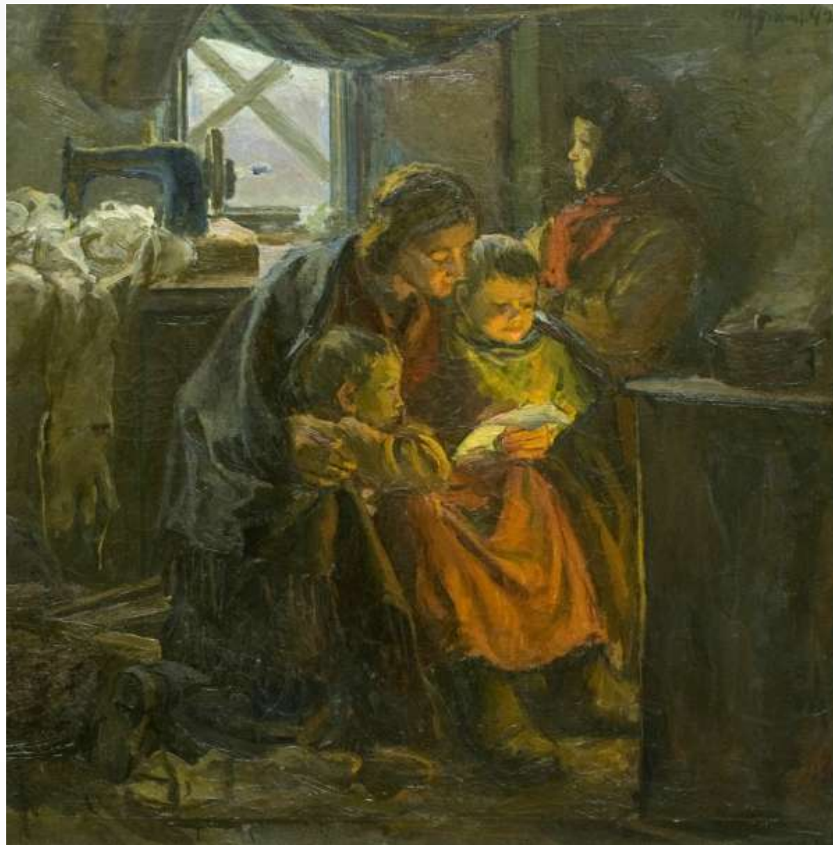
Шурпин Ф.С. Письмо с фронта. 1942 г.