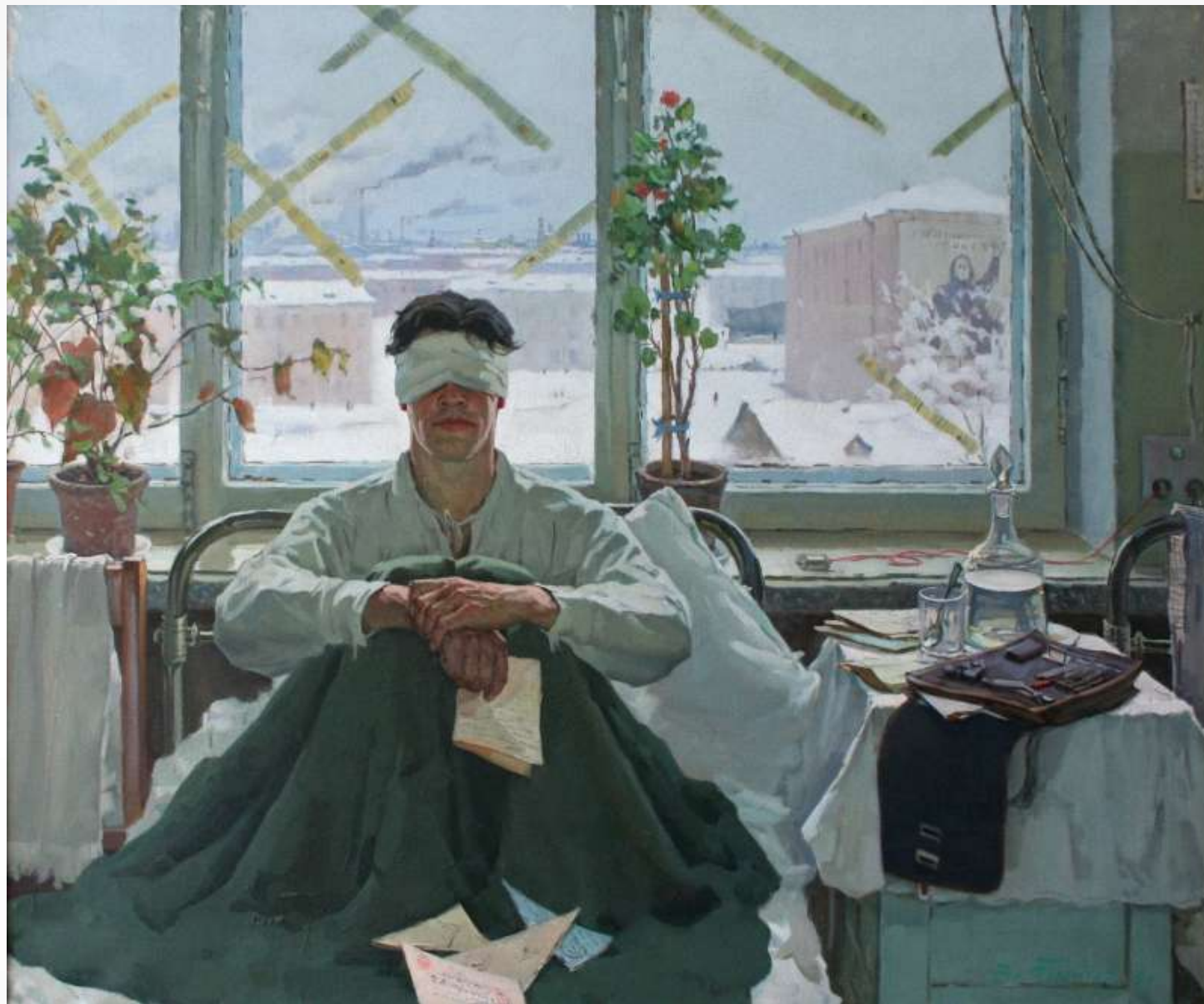
ТИТОВ В.Г. Письма. 1970 г.