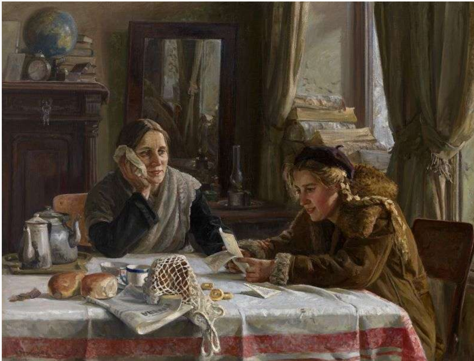
Терпсихоров Н. Письмо с фронта