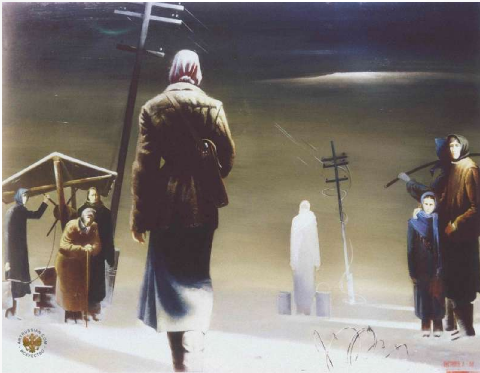
Выстропов А.П. Известие. 1987 г.