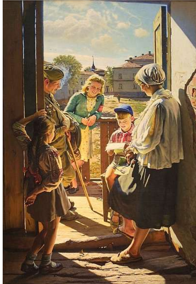
Лактионов И.А. Письмо с фронта. 1947