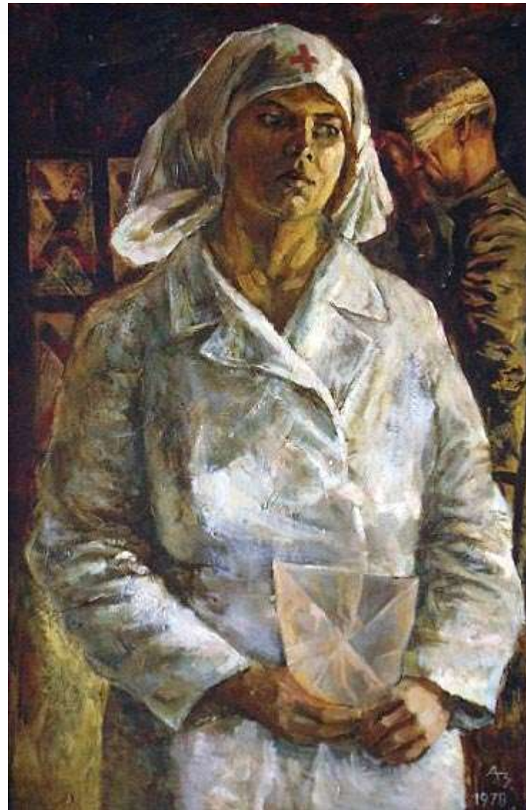
Знаменский А.А. Фронтовое письмо