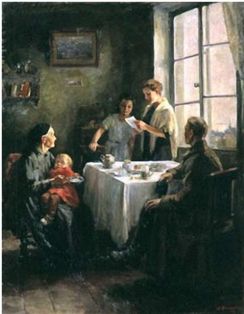
Ватолина Н.Н. Вести с фронта