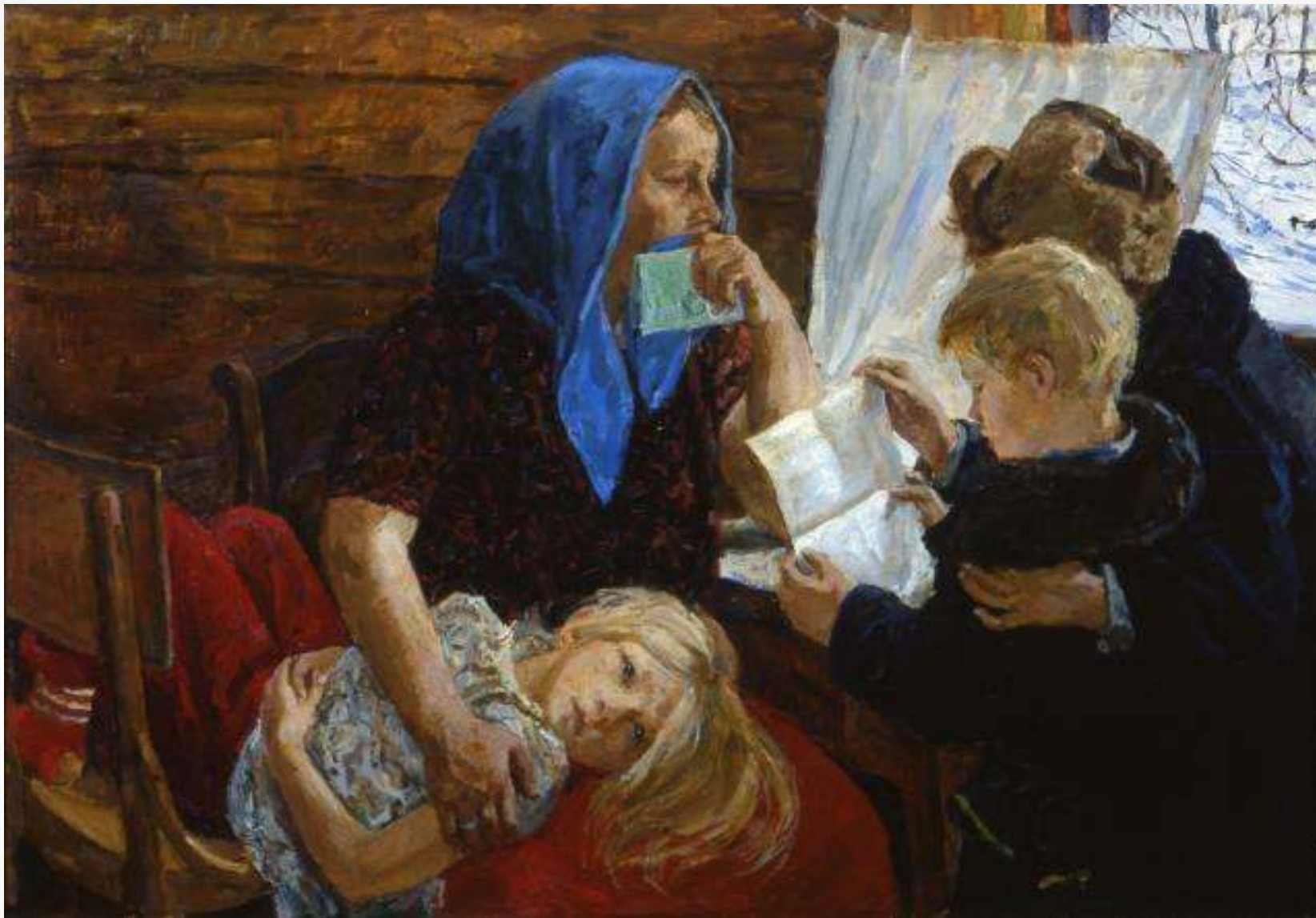
Пластов А.А. Письмо 1971