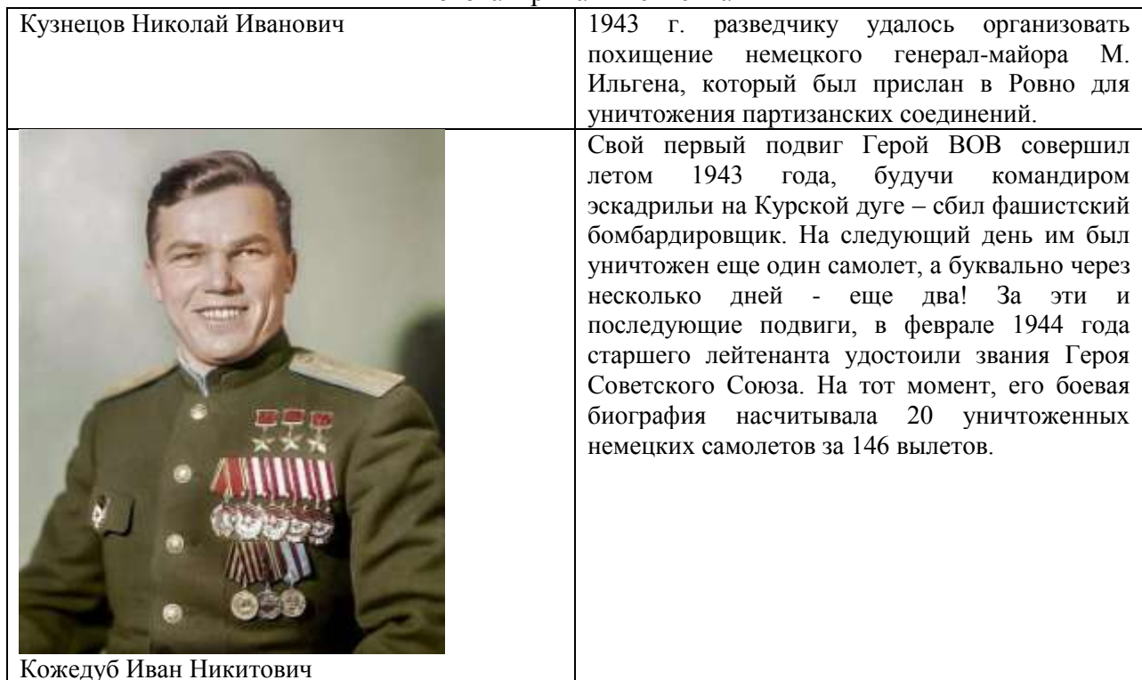
Кожедуб Иван Никитович