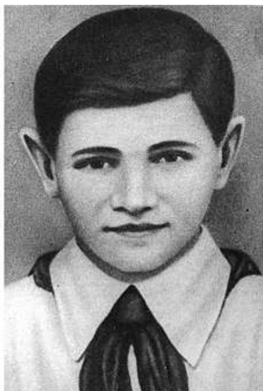
Котик Валентин Александрович

С февраля 1943 г. он командовал войсками Центрального фронта на Курской дуге и сумел подготовить войска к предстоящему летнему наступлению противника. 5 июля 1943 г. он на 10 минут опередил противника в нанесении артиллерийского удара. Это явилось для немецкого командования неожиданностью и задержало начало операции «Цитадель».