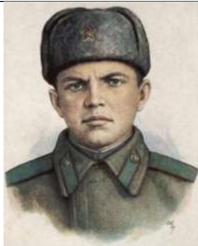
Матросов Александр Матвеевич

С 25 февраля 1943 г. проходил службу во 2-ом отдельном стрелковом батальоне 91-й отдельной Сибирской добровольческой бригады им. В.И. Сталина. Свой, прогремевший на всю страну подвиг, он совершил 27 февраля 1943 г., когда батальон пошел в атаку на опорный пункт недалеко от деревни Чернушки Псковской области. Выходя из леса на опушку, наши солдаты попали под пулеметный огонь, источником которого были три дзота немцев, прикрывавших подступы к деревне. Две точки были подавлены быстро, а третьему пулемету удавалось довольно долго простреливать всю ложину, расположенную перед деревней. В очередной попытке заставить пулемет замолчать, в сторону врага поползли рядовые, один из них, Огурцов получил ранение, другой решил довести дело до конца самостоятельно, бросил на дзот две гранаты, и тот затих. Но вскоре фашисты вновь открыли огонь по советским солдатам. Тогда он резко бросился к амбразуре пулемета и закрыл ее своим телом. Этот подвиг стоил ему жизни, благодаря этому, батальон смог выполнить свою боевую задачу.