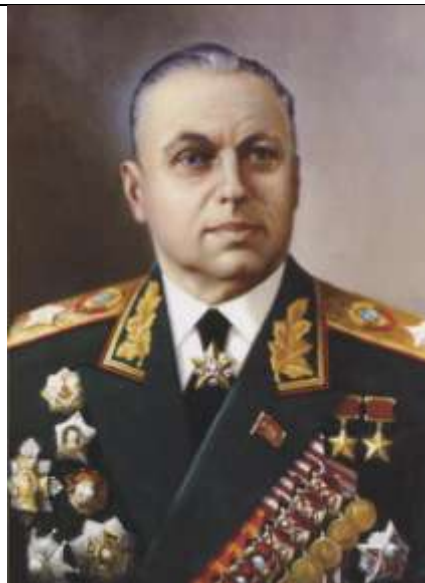
Рокоссовский Константин Константинович

Маршал Советского Союза. Дважды Герой Советского Союза. В годы Великой Отечественной войны командовал механизированным корпусом, 16-й армией. Был командующим Брянского, Донского, Центрального, Белорусского, 1-го и 2-го Белорусских фронтов. Руководил боевыми действиями войск в битвах под Сталинградом и Курском, в разгроме немецко-фашистских войск в Белоруссии и Восточной Пруссии, в Восточно-Померанской и Берлинской операциях.